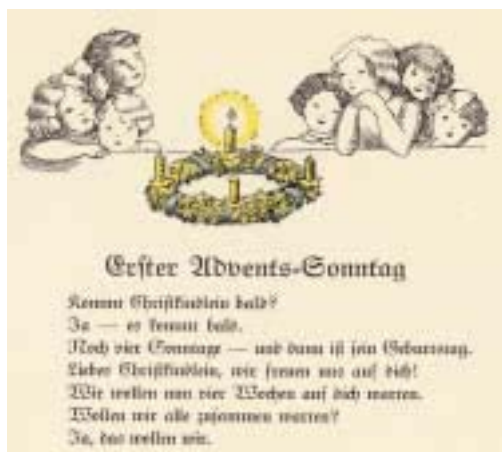
DER CHRISTLICHE ADVENT, DARGESTELLT IN EINEM RELIGIÖSEN KINDERBUCH, 1934 *35

Das Wort Advent stammt aus dem Lateinischen von adventus (Ankunft) und bezeichnet die Vorbereitungszeit auf das Fest der Geburt Christi. Durch Fasten und Buße sollen sich die Gläubigen in dieser Zeit auf die Ankunft des Erlösers vorbereiten. Die Festlegung auf vier Sonntage erfolgte unter Papst Gregor dem Großen (590–604) und wurde ab 826, nach dem Konzil zu Aachen, auch im deutschsprachigen Raum übernommen. Mit dem 1. Adventssonntag beginnt gleichzeitig das Kirchenjahr *31 .