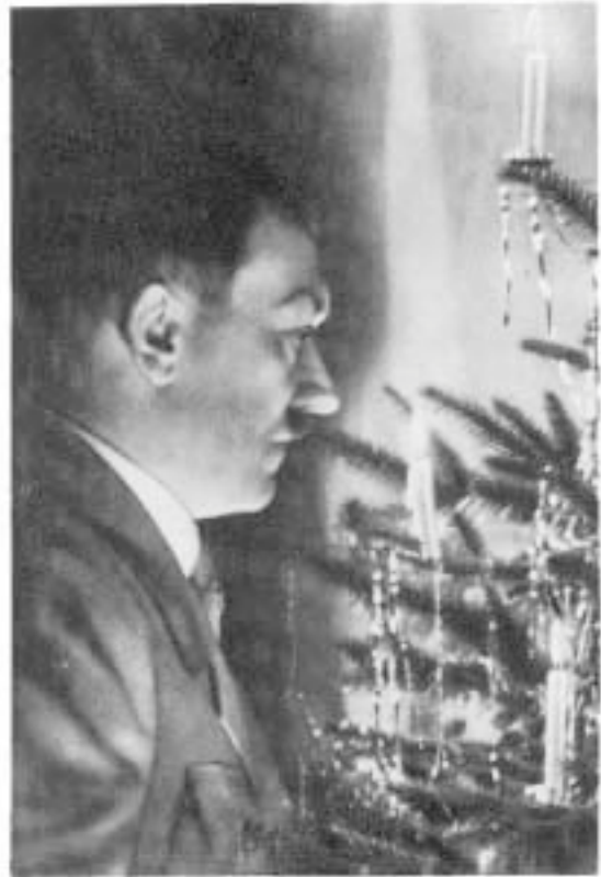
DIE AUFNAHME "DEUTSCHE WEIHNACHT" ZEIGTE HITLER VOR EINEM LAMETTA-GESCHMÜCKTEN WEIHNACHTSBAUM *54 .

Selbst innerhalb der nationalsozialistischen Anhängerschaft gab es widersprüchliche Ansichten zum "richtigen" Schmuck des Baumes: So wurde z.B. eine von Heinrich Hoffmann angefertigte Aufnahme veröffentlicht, die Hitler ausgerechnet vor einem nur mit Lametta geschmückten Weihnachtsbaum zeigte *30 .