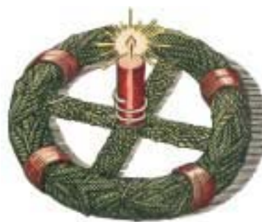
KERZE AUF HAKENKREUZ-KRANZ IN: KALENDER "VORWEIHNACHTEN", 1942 *32

Volkstümlicher Kindervers zur Weihnachtszeit