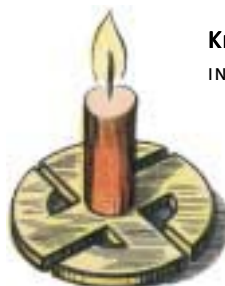
HAKENKREUZ ALS KERZENHALTER IN: KALENDER "VORWEIHNACHTEN", 1942 *32

Wir winden den Kranz aus Tannen dem Kreise des Jahres zum Lob und zünden, das Dunkel zu bannen, vier strahlende Kerzen darob.