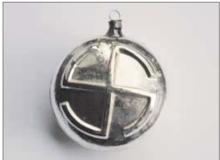
RUNEN-KUGEL MIT HAKENKREUZ-MOTIV (SAMMLUNG RITA BREUER)